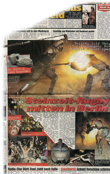
BILD Zeitung Seite 7, 23.08.03