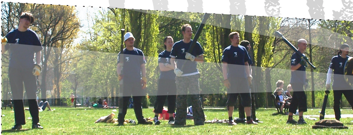
TEAM JUGGERFALKEN AN DER GRUNDLINIE

Vier der fünf Spieler sind mit sogenannten Pompfen ausgestattet, den Spielgeräten des Juggerns. Wird ein Spieler von einer solchen Pompfe getroffen, kann er eine zeitlang nicht ins Spielgeschehen eingreifen. Der fünfte Spieler, der Läufer, trägt keine Pompfe. Er ist der einzige, der den Jugg in die Hand nehmen darf. Seine Aufgabe ist es, geschützt durch seine Mitspieler den Jugg zu platzieren und damit zu punkten.