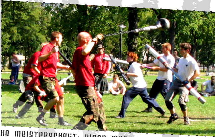
8. DEUTSCHE MEISTERSCHAFT: RIGOR MORTIS VS. JUGGERHOOD OF SAAR