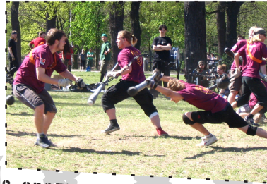
KOMMANDO-SPEZIAL-JUGGER vs. JUGGERDANIELS