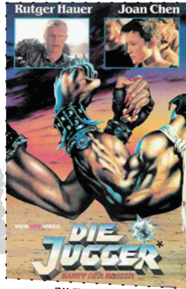
FILMPLAKAT VON 1989

1989: Der Endzeitfilm „Die Juggo - Kampf der Besten“ (Australien) kommt in die Kinos. Regie und Drehbuch David Peoples.