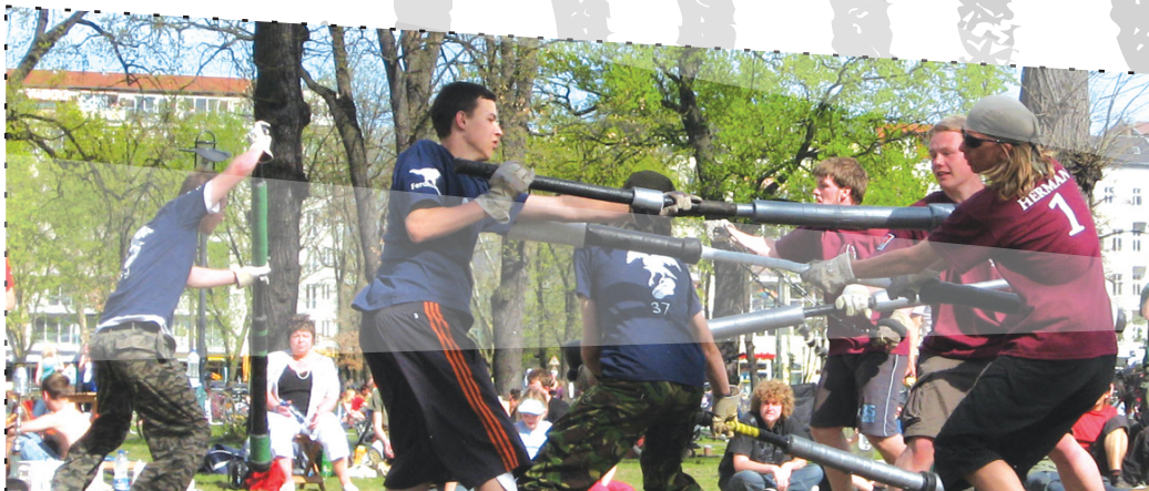
JUGGERFALKEN VS. KOMMANDO-SPEZIAL-JUGGER BEIM BERLINER JUGGERPOKAL

2008: 31 Teams, darunter eins aus AUSTRALIEN und eins aus IRLAND nehmen an der 11. Deutschen Meisterschaft teil.