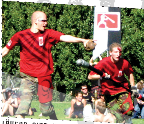
LÄUFER GIBT KOMMANDOS