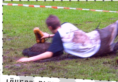
LÄUFER PLATZIERT DEN JUGG