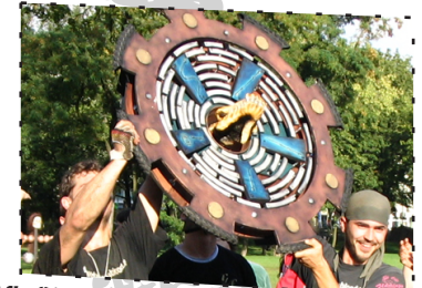
LIGA-SIEGER 2004: DRACHENBLUT

An Juggo League-Turnieren kann jedes Team teilnehmen.