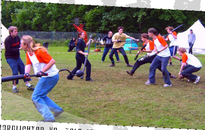
NORDLICHTER vs. ZOLA IN BAD OLDESLOE