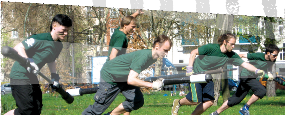
TEAM GRÜNANLAGEN GUERRILLA BEIM ANRENNEN RICHTUNG SPIELFELDMITTE

Seit 2003 die Juggo League gegründet wurde, erfreut sich das Juggern immer größerer Beliebtheit. Deutschlandweit gründen sich ständig neue Teams