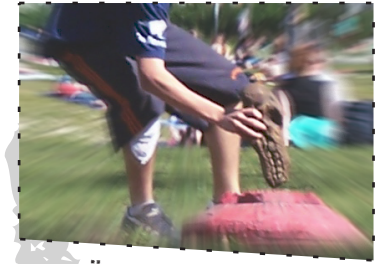
LÄUFER BEIM PUNKTEN

Jugger ist eine Mischung aus American-Football und Gladiatorenkämpfen: Zwei Mannschaften à fünf Feldspieler versuchen den Jugg, den Spielball, in der Mitte des Spielfeldes zu erobern und ins Platzierfeld der gegnerischen Mannschaft zu tragen.