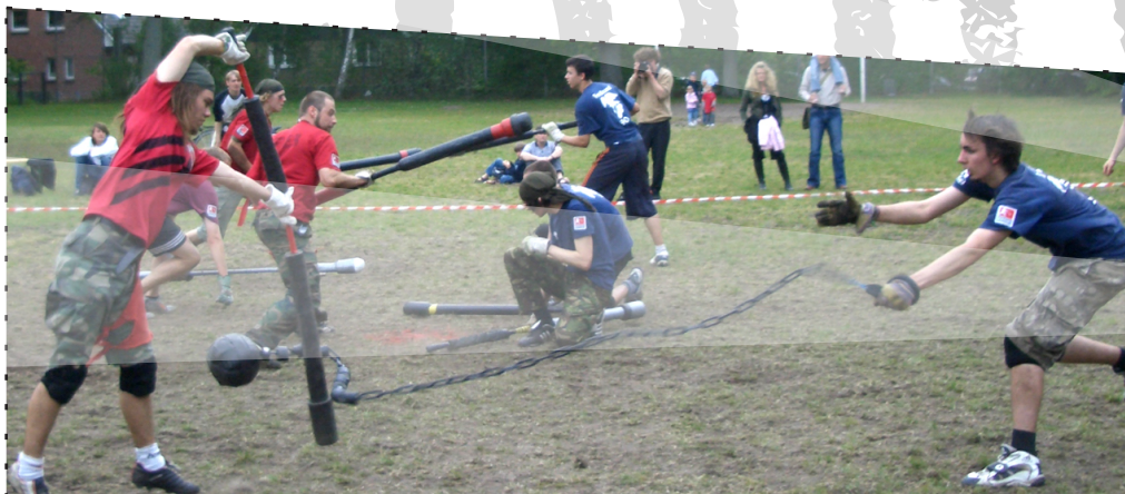
KETTENSCHWUNG WIRD ABGEWEHRT RIGOR MORTIS VS. JUBBERFALKEN IN LÜBECK

Das Spielfeld misst 20 x 40 Meter. Jede Mannschaft besitzt an ihrer Feldseite ein punktförmiges Mal, das es zu schützen gilt. Als Spielball dient ein künstlicher Hundeschädel (Jugg) aus Schaumstoff oder ein Rugby-Ei. Jedes Team besteht aus 5 Spielern: ein Läufer (Quick), ein Kettenmann und drei Kämpfer (Pompfer). Dazu sind maximal drei Ersatzspieler erlaubt. Der Läufer ist unbewaffnet und darf als einziger den Jugg aufnehmen.