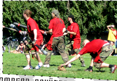
POMPFER SCHÜTZEN IHREN LÄUFER